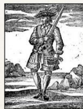
Rackham le Rouge

Verbaliser pour rendre compréhensible son argumentation (entre pairs)