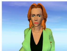
Plan rapproché poitrine