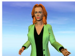
Plan rapproché taille