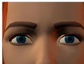
Très gros plan

Ellipse : dans un discours narratif, élément d'histoire qui ne donne pas lieu à une narration.