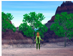
Plan de demi-ensemble