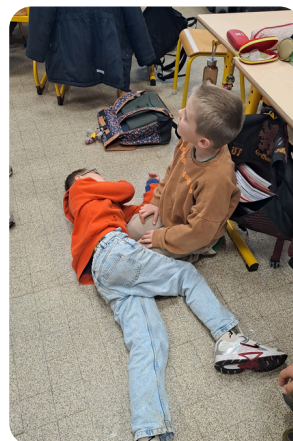
Mettre la victime en position latérale de sécurité

A venir en période 3 : ➔ Rencontre tennis à l'école Poppa de Valois le 9 janvier