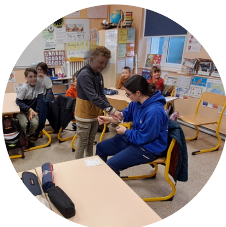
Intervenir en cas de saignement