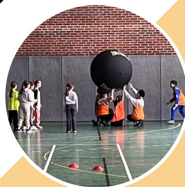
Les rencontres sports innovants