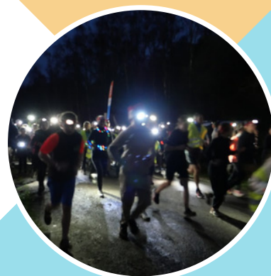
Trail nocturne USEP/UNSS