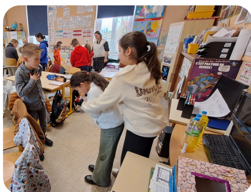
Intervenir en cas d'étouffement

Analyser une situation, prendre des informations pour appeler les secours.