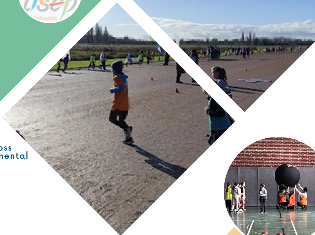
Le cross départemental