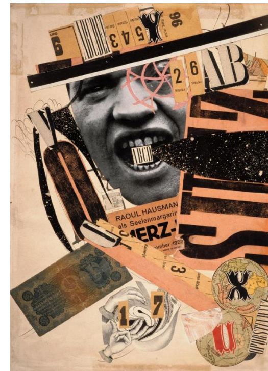
ABCD, Raoul Hausmann, 1923-1924 (Collage DADA)