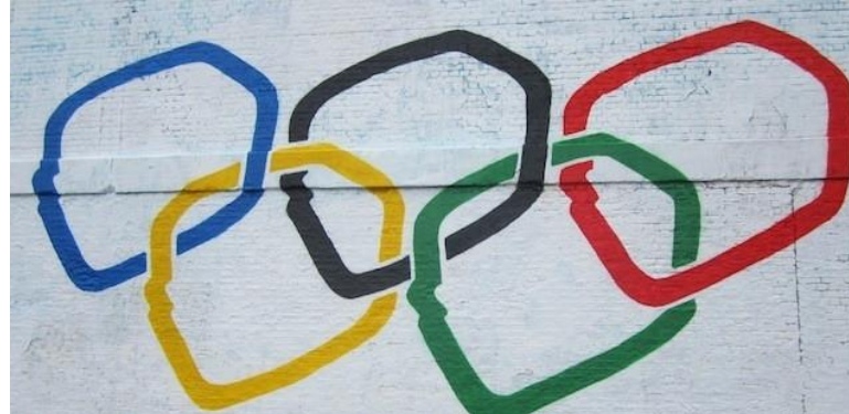
Olympic rings, Toaster Crew