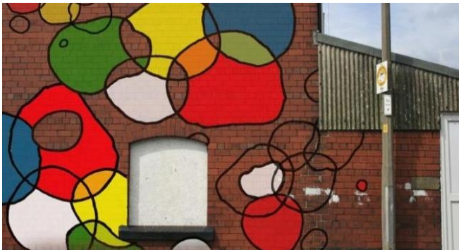
Olympic Street Art, Andy Mercer

Certains artistes du Street Art se sont emparés du sujet.