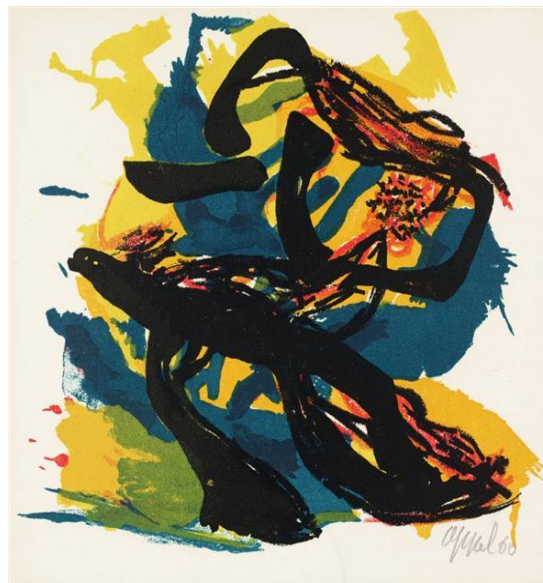
Untitled, Karel Appel, 1960 (tachisme)