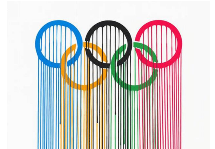
Liquidated logos, Zevs