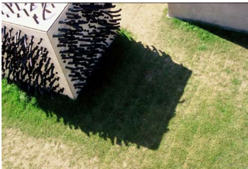
Le Champs d'Expérience, Maison des Compagnons du Devoir, Angers, 2001