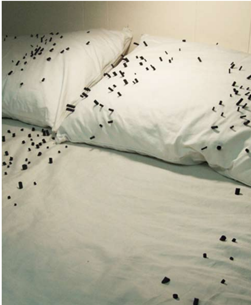
Rémanence, installation 2009 (détail) © Christine Maigne