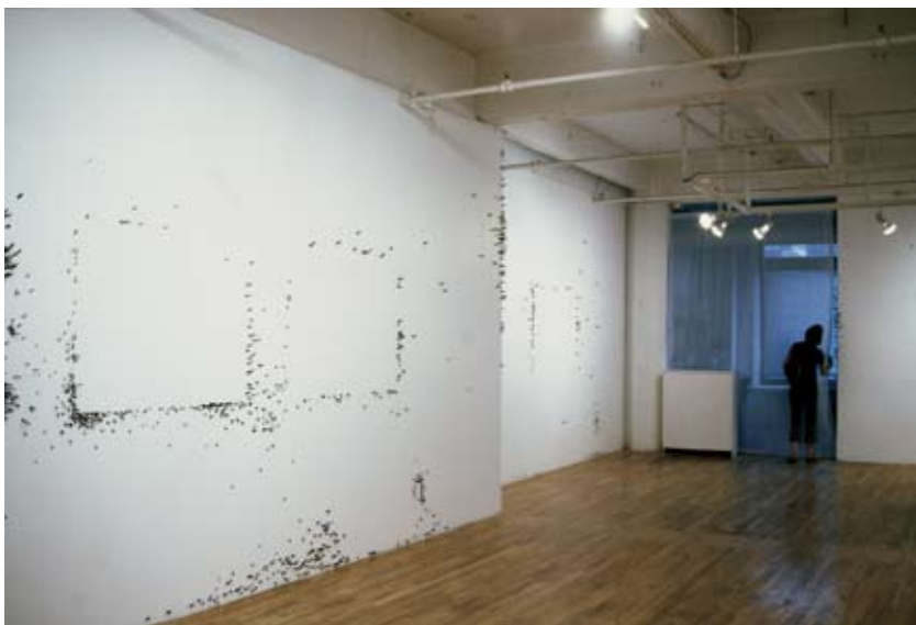
Eruption II, Dare dare, Montréal, 2001