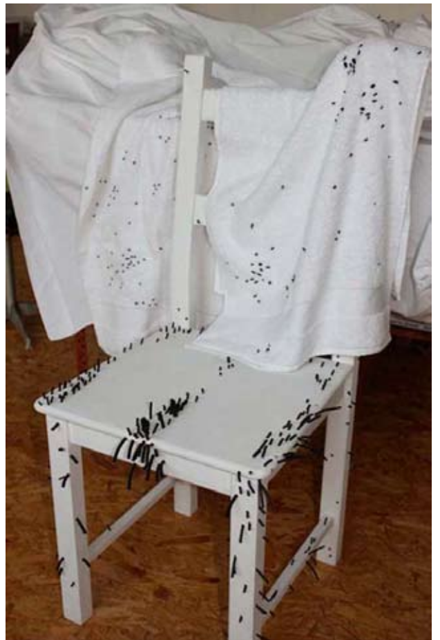
Rémanence , installation 2010, vues d'atelier, © Christine Maigne