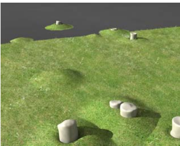
Simulations 3D du projet d'Audrieu.