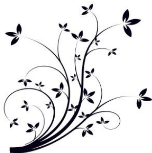
Voilà le printemps !