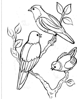
Les oiseaux chantent.