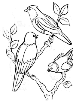
Les oiseaux chantent.