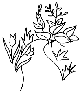
Les fontaines jaillissent.