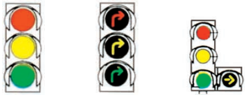
a) de forme circulaire b) en forme de flèche Flèche supplémentaire associée aux feux tricolores PRIORITY AUX PIÉTONS