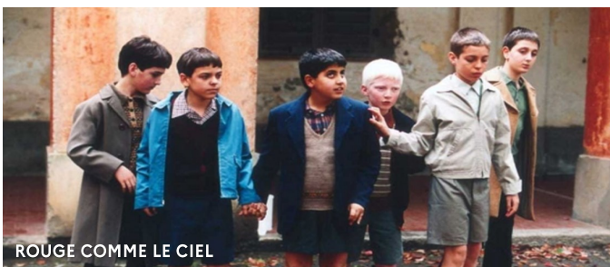
ROUGE COMME LE CIEL

Lancement des appels à projet à partir d'octobre.