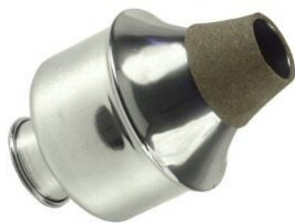
Sourdine wa wa